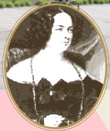
Садина у Верхівні — гніздечко закоханих Бальзака і пані Ганської.