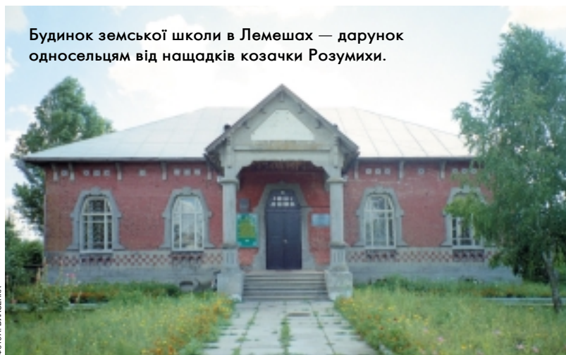
Будинок земської школи в Лемешах — дарунок односельцям від нащадків козачки Розумихи.

Старший брат Олексій Розум був ставний, вродливий, із сильним і приємним голосом. Про майбутнє своє він здогадуватися не міг, тому кар'єру почав скромно — пас худобу, та ще й не свою, а громадську. Згодом хлопець почав ходити в сусідній Чемер навчатися і співати у церковному хорі. І ось на різдвяні свята 1731 року в маленьке село завітала сама Фортуна в образі полковника Федора Вишневського, який виконував важливу місію доставки токайського вина з Угорщини до царського двору. Завітавши до місцевої церкви на святкове богослужіння, він був уражений співом і вродою юнака й запросив його до Петербурга. Там 22-річний Олексій потрапив до придворного хору і впав в око молодій царівні. Зійшовши на престол, Єлизавета Петрівна надала Олексієві титул графа, звання фельдмаршала, подарувала землі в Україні... Графами стали і його